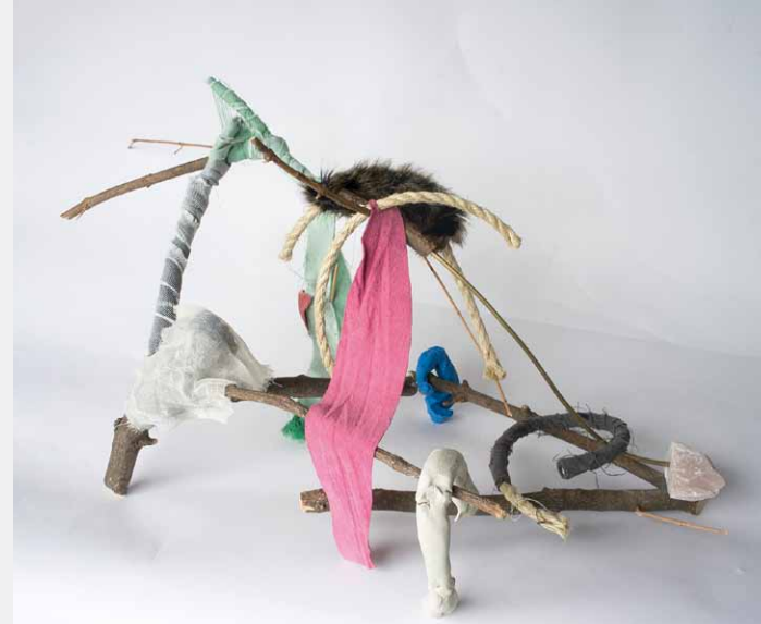
Eiko Ishizawa 'Untitled and feeling good' • diverse materialen • 2014 • 60 x 88 x 50 cm

Curatoren: Hanne Hagenars en Heske ten Cate